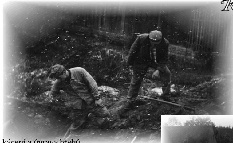
kácení a úprava břehů

Ano i koupaliště si zdelováci vybudovali sami v akci „Z“adarmo. Takto vypadalo koupaliště v době své největší slávy. Na Zdelov to je dílo až neuvěřitelné.