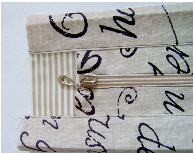
9 zdrhovadlo všité mezi proužky