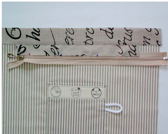
8 přišítí poloviny zdrhovadla na proužek