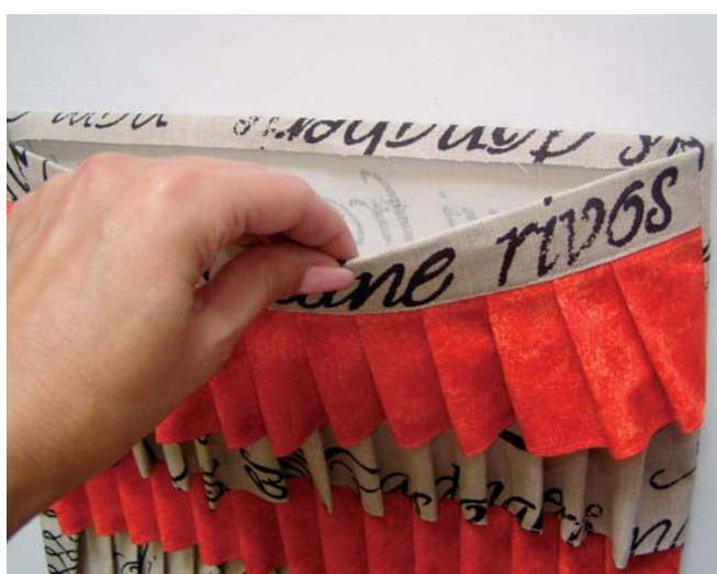
5 založený a zažehlený horní okraj