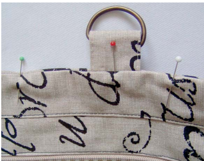
11 vložení a všití podšívky a proužku do tašky