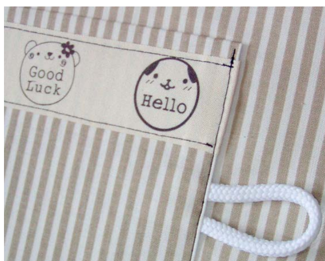
6 podšívkový díl s malou kapsou