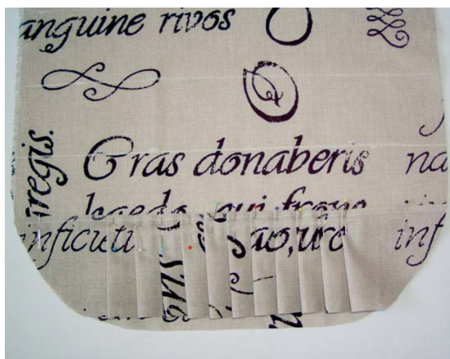
1 označený díl s přišitým volánem