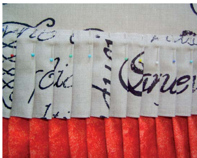
2 postupné přišívání volánů