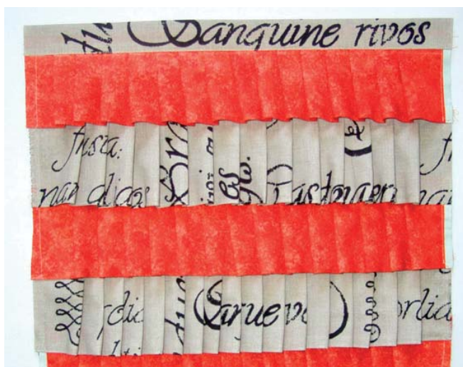
3 volánový díl s přišitým proužkem k hornímu okraji