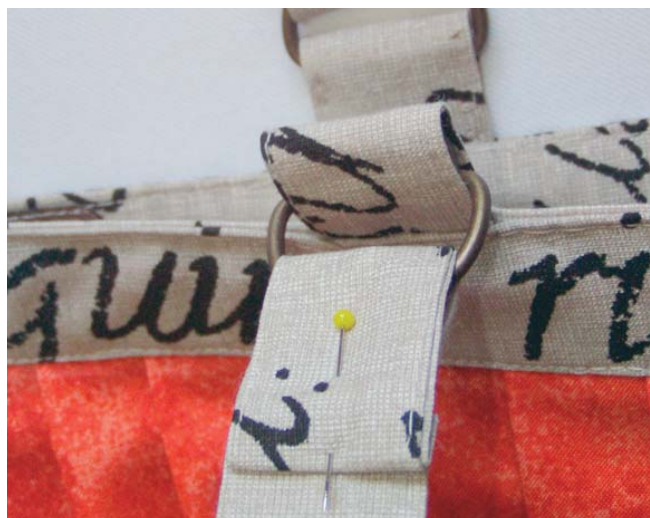
12 přišítí uch