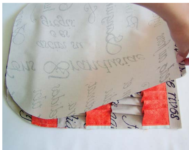
4 sešití předního a zadního dílu