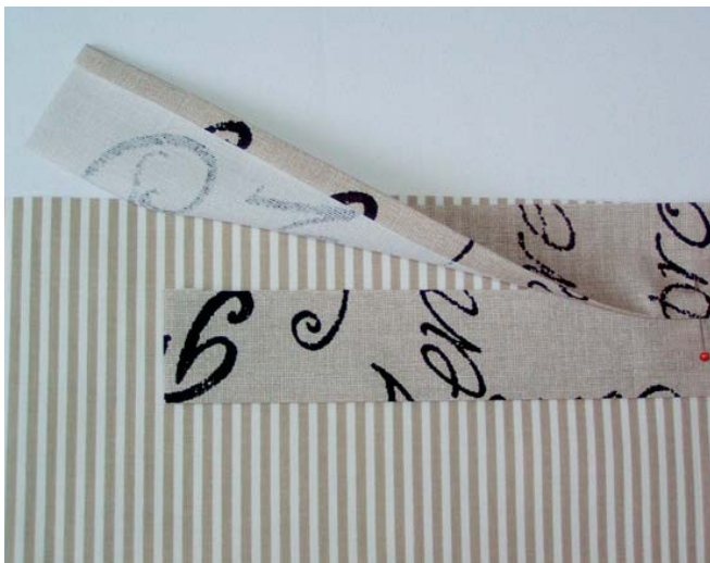
7 podšívka s přiloženým pruhem a sešitým proužkem